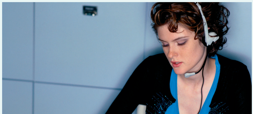
Egal, ob Bestellungen per Telefon eingehen oder elektronisch, die Software21 führt sie aufgrund kundenspezifischer Vorgaben automatisch aus.

Die Software21 ermöglicht Ihnen vielfältige individuelle Auswertungen zu Kunden, Artikeln, Titelsegmenten sowie zu Ihrem Außendienst. Mit ihnen sind Sie auch gegenüber Ihren Mandanten stets auskunftsfähig. Auf ihrer Basis ist auch die Verlagsabrechnung individuell gestaltbar.