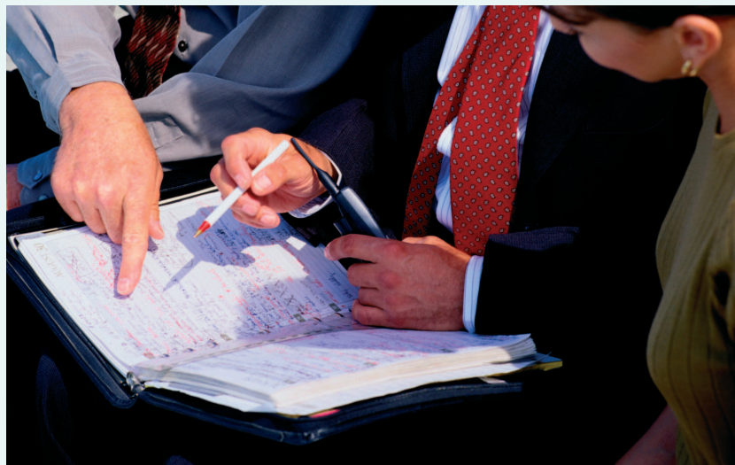
Übersichtlich und sicher überwachen Sie Ihre Termine mit dem Termin- und Jobverwaltungssystem von BASIS.

■ Auswertungen und Statistiken stellen Sie aus dem gesamten System in Inhalt, Form, Reihenfolge, Summenbildung etc. mit variablen Instrumenten selbst zusammen.