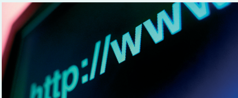
Elektronisch übermittelte Bestellungen von den Bestellanstalten oder aus einem Webshop gehen direkt in die Auftragsbearbeitung von VERA ein.

VERA legt Rechnungen, Gutschriften und andere Belege für Auskünfte, zur Duplikaterstellung oder für die automatische Stornofunktion in einem Archiv ab.