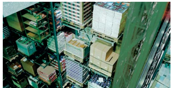
Gemeinsam haben Butzon&Bercker und synthesis die Anforderungen an eine Unterstützung des Auslieferungszentrums Niederrhein durch die Software21 festgelegt.

stallation um das Zeitschriftenmodul ZARA. Weitere Ergänzungen betrafen die Kommissionsabwicklung mit kundenspezifischen Lägern und die Einführung eines Benutzerbegriffungskonzepts zur Abgrenzung der einzelnen Verlage. „Diese Erweiterungen zeigen, wie flexibel sich die Software21