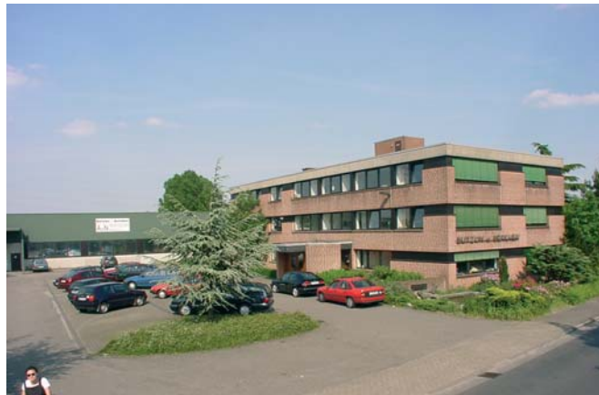
Zwischen 1977 und 1981 siedelte der gesamte Betrieb der Butzon&Bercker-Gruppe aus der Kevelaerer Innenstadt in sein neues Gebäude auf dem Hoogeweg in einem Außenbezirk von Kevelaer.

Heute wird das Unternehmen von der fünften Inhabergeneration erfolgreich geführt. Im Geschäftsbereich Buch publiziert Butzon&Bercker, seit 1991 verstärkt durch den Lahn-Verlag, Literatur und Sachbücher zu christlichen Themen. Den zweiten Schwerpunkt bilden christliche Kunst und religiös geprägtes Kunsthandwerk, dessen Produktprogramm von Bronzekreuz und Weihnachtsskripen