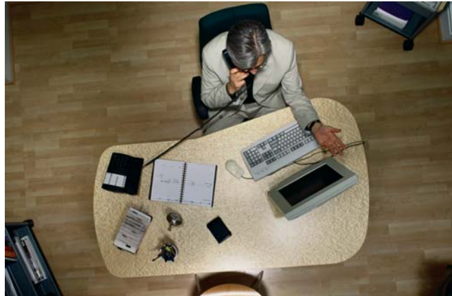
Mit dem Kontakt-Managementsystem der SOFTWARE21 haben Sie nicht nur einen schnellen Überblick über Ihre Kundendaten, sie steuern mit ihm auch die Kontaktaufnahme - über Telefon, Fax oder Email.

Neue Kontakte aufzubauen und damit Neukunden zu gewinnen oder bestehende Kundenbeziehungen besser zu nutzen (Up- und Cross-Selling) bestimmen heute die Ausrichtung der CRM-Anwendung. Entscheidend werde