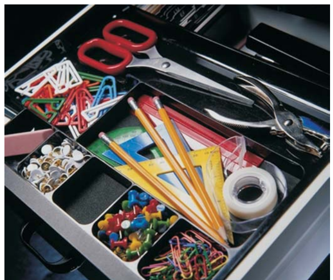
Auch Produkte aus dem Zusatzsortiment können in Warengruppenpakete eingebunden und als „Titelset“ mit der SOFTWARE21 schnell und effizient verwaltet werden.

Auf saisonale und Trendthemen schnell mit einem aktuellen Sortiment